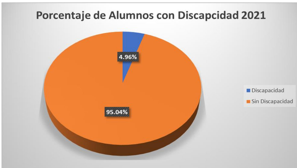
Gráfico 1. Proporción de alumnos con discapacidad año 2021.